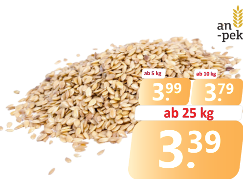
SESAM geschält | Sa. = 25 kg