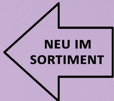
DOONY'S MINI DONUT FRUITY BITES Kt. = 90 Stk. | Stk. = 22g