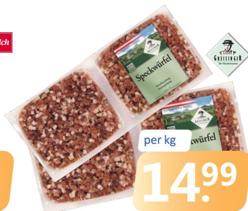
SPECKWÜRFEL Pkg. = ca. 1,3 kg