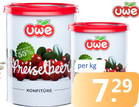
PREISELBEERKONFITÜRE herb | Ds. =4,5 kg