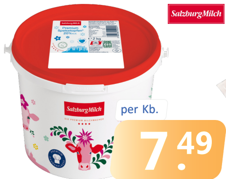
PREMIUM TOPFEN Kb. = 2 kg | 20%