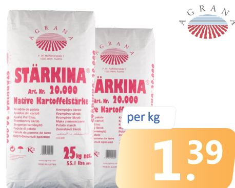
KARTOFFELMEHL Sa. = 25 kg