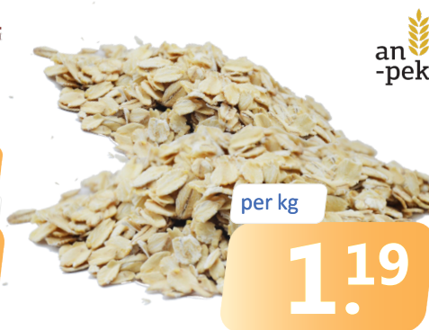
HAFERFLOCKEN Sa. = 15 kg