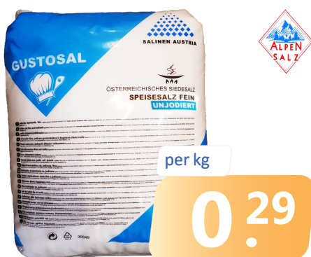
SPEISESALZ UNJODIERT fein | Sa.= 25 kg