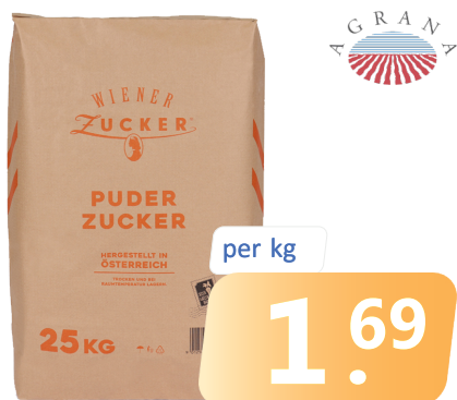
WIENER PUDERZUCKER Sa. = 25 kg

AKTION GÜLTIG VOM 02. SEPTEMBER - 28. SEPTEMBER 2024