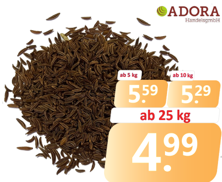
KÜMMEL ganz | Sa. = 25 kg